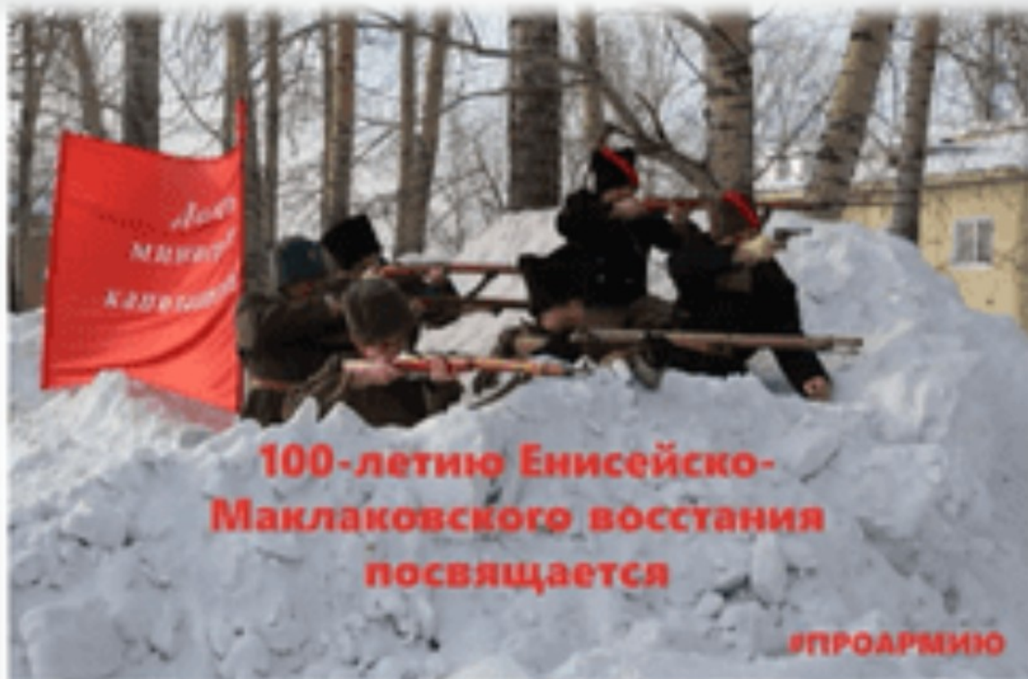
Енисейско-Маклаковскому восстанию – 100 лет

Акция-Ретроспектива от Красноярского Дома Офицеров #ПРОАРМИЮ